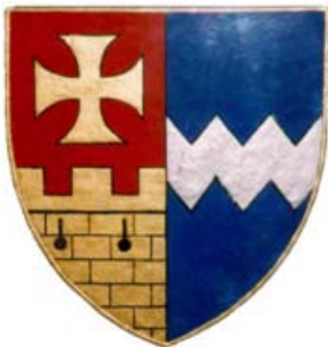
Kopiert von der Verleihungsurkunde

„Ein von Rot auf Blau gespaltener Schild, der in seinem vorderen Feld über einer zinnenbekränzten, zwei schwarze Schießscharten aufweisenden goldenen Mauer ein ebensolches schwebendes Tatzenkreuz, in seinem hinteren Teil einen silbernen Zackenbalken zeigt.“