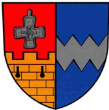
DAS WAPPEN DER MARKTGEMEINDE BERNHARDSTHAL. MARKTFÄHRNK ROT - GELB - BLAU WAPPENVERLEIHUNG 17. DEZEMBER 1974

Bevor aber die Wappenverleihungsurkunde übergeben wurde verfertigte Walter Berger einen Entwurf nach den ursprünglichen Intentionen für das Heimatbuch. Nämlich eine Zeichnung des auf den Heidfleck gefundenen Bleikreuzes im roten Feld, natürlich Blei entsprechend in grauer Farbe, und den Zackenbalken in gleicher Farbe. Das Grau läßt sich eventuell auch als Silber interpretieren.