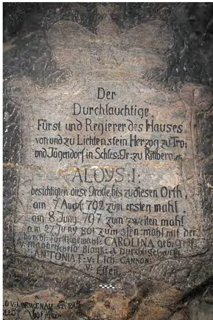
Abb. 5, Gedenktafel an den Besuch des Stifters und Besitzers des Nachlasses, Fürst Alois I. Joseph von Liechtenstein / Pamětní deska donátora a majitele panství knížete Aloise I. Josefa z Liechtensteina.