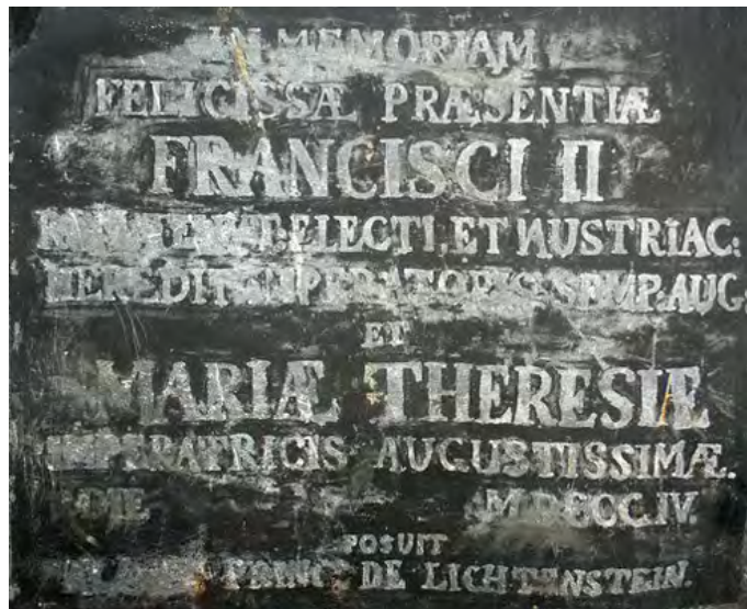
Abb. 2, Gedenktafel an den Besuch des Kaiserpaares Franz II. und seine Frau Maria Theresia im Jahre 1804 / Pamětní deska připomínající návštěvu císaře Františka II. a jeho manželky v roce 1804.

Gibt es eine „Lola-Karte“ vom Stier-Felsen? / Existuje Lolova mapa Býčí skály?