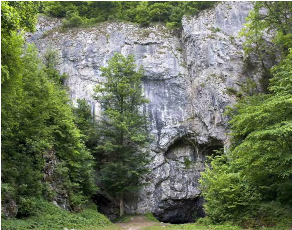
Abb. 1, Stier-Felsen / Býčí skála.