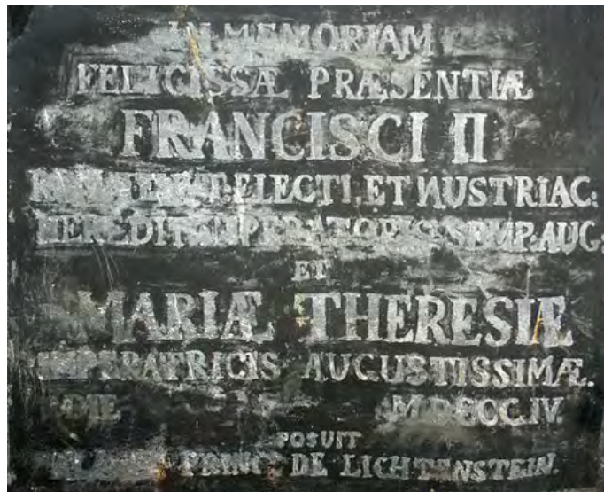
Abb. 2, Gedenktafel an den Besuch des Kaiserpaars Franz II. und seine Frau Maria Theresia im Jahre 1804 / Pamětní deska připomínající návštěvu císaře Františka II. a jeho manželky v roce 1804.

Gibt es eine „Lola-Karte“ vom Stier-Felsen? / Existuje Lolova mapa Býčí skály?