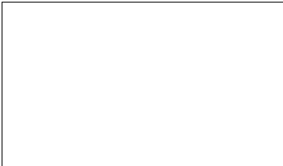
Abb. 60: Katzelsdorf, Kirchenpark.

nierte man nach Ablöse von Presshäusern und Gartenflächen das Gelände um die Kirche, die 1905 abgerissen und unter der Bauleitung des fürstlich Liechtensteinischen Hausarchitekten Karl Weinbrenner neu errichtet wurde. 118 Der Patronatsherr, Fürst Johann II. von Liechtenstein (1840-1929) - er ließ in dieser Funktion „unzählige Kirchen, Kapellen und Pfarrhäuser renovieren, er finanzierte zahlreiche Neubauten von Kirchen“ 119 -, veranlasste auch die Ausstat-