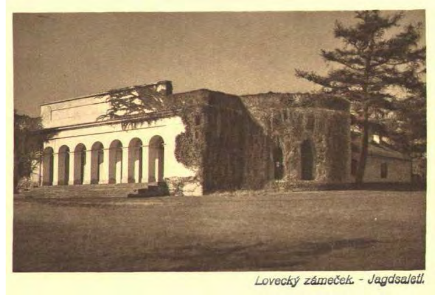
Zámeček v letech 1900-1930 a myslivna po roce 1948 / Schlössl in den Jahren 1900-1930 und Forsthaus nach 1948