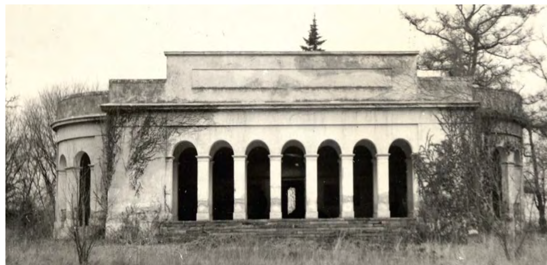
Zámeček smyslivnou po požáru v roce 1956 / Schlössl und Forsthaus nach dem Brand im Jahre 1956