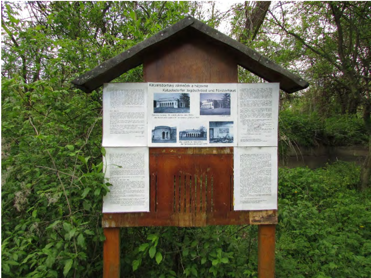
vor und nach der Erneuerung am 7. Mai 2016