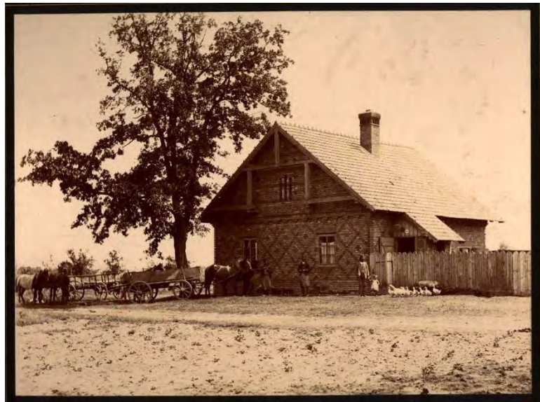
Abb. 1 Vlašic Hegerhaus beim Theim-Hof, rund um 1916

Bis zum Abriss in den frühen 50er Jahren blieb das Haus unbewohnt. Man findet das Objekt auch als dunklen Gebäudebestand auf einer Luftaufnahme aus dem Jahr 1952, zu jener Zeit also, als von unserem Staatsgebiet Luftbildaufnahmen gemacht wurden (1952-1953). Auf einer topographischen Karte, basierend auf Karten aus den Jahren 1954 bzw. 1960, ist das Bauwerk nicht mehr eingezeichnet. Auf Online-Kartenportalen des frühen 21. Jahrhunderts findet man den Ort des ehemaligen Hegerhauses bei der heute dort verlaufenden Gaspipeline [plynovod]. Nach den Worten eines Zeitzeugen existierte 1964 vom Forsthaus nur mehr das Fundament. Heute gibt es dort - bis auf Obstbäume und einen Brunnen - kaum noch Spuren von den Grundmauern.