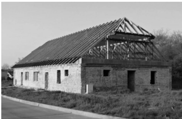
Bývalý dělnický domek s byty (stav duben 2014) Das ehemalige Arbeiterhaus mit Wohnungen (Stand April 2014)