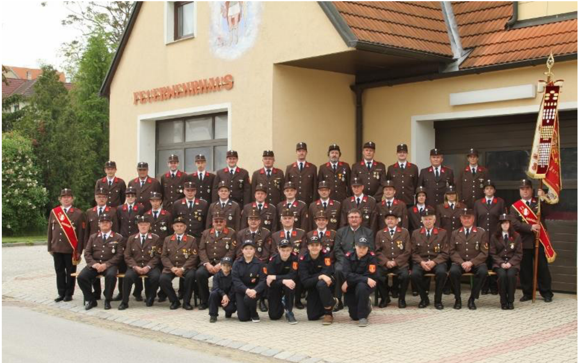
Die Kameraden der Freiwilligen Feuerwehr Katzelsdorf, 2014.