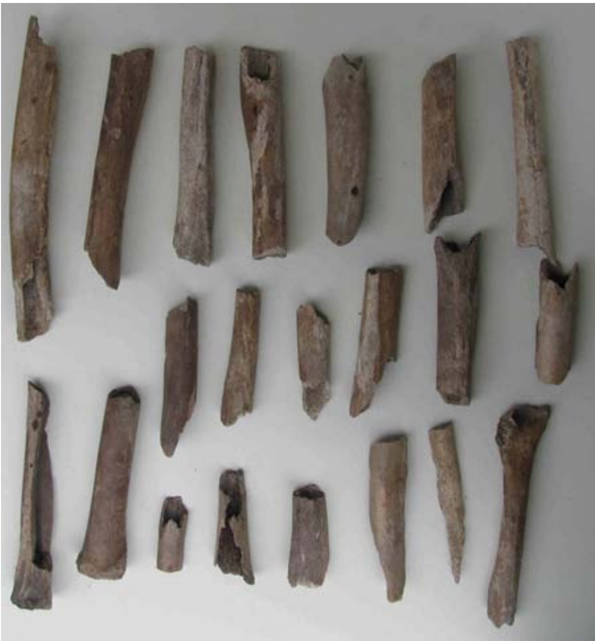
Knochenreste aus dem Teich

Schon 1838, siehe im Bericht von Pfarrer Konall, wurden viele Gebeine und Schädel aufgefunden. Wick erwähnt 1891 einen Skelettfund. Auch bei den Baggerarbeiten 1990 waren Skelettreste im Abfuhrgut, wurden aber leider nicht näher untersucht. Im auf den Unfriede abgelagerten Material waren jedenfalls Knochen zu finden.