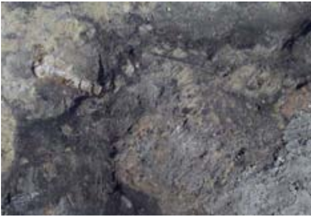
Schlüssel im Eingangsbereich

Die weitere Ausgrabung ergab zumindest 3 Bauphasen.