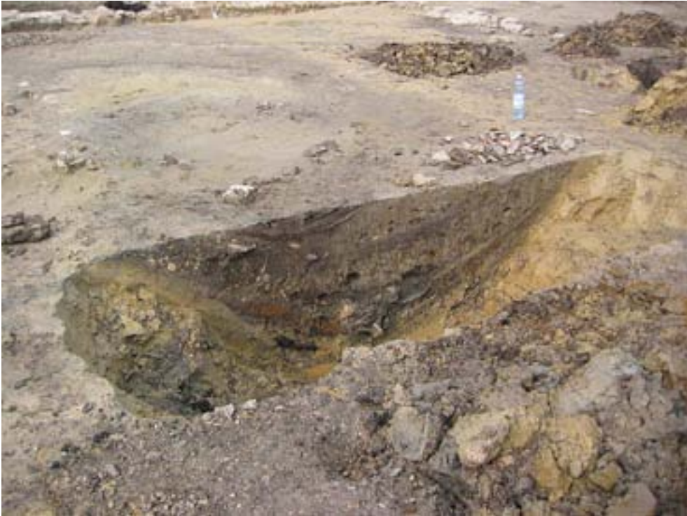
Schnitt des alten Grabens