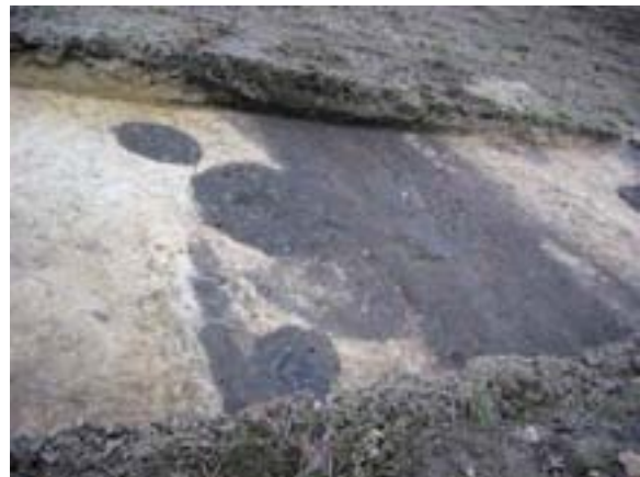
Ende des aufgedeckten Bereichs