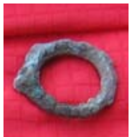
Griffabschluß eines Messers