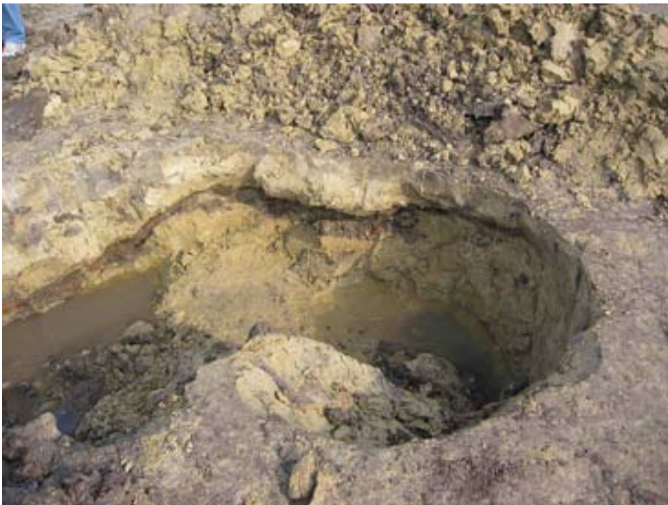
Urnenfelderzeitliche Fundschicht unter der Nordostecke