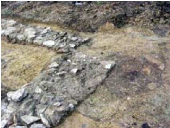
NW-Ecke mit großem und kleinem Kreis