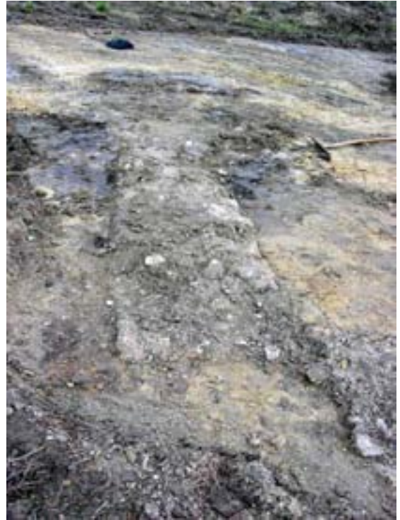
Nordseite gegen Osten