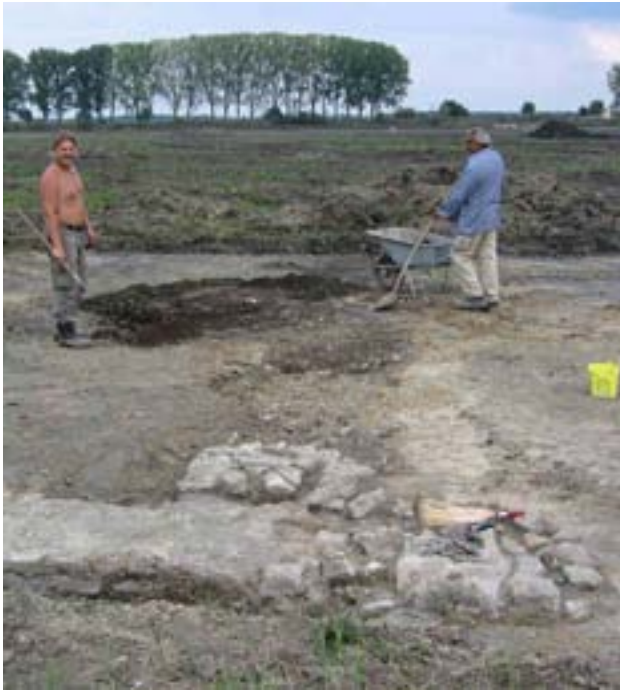
Südseite mit Brandresten