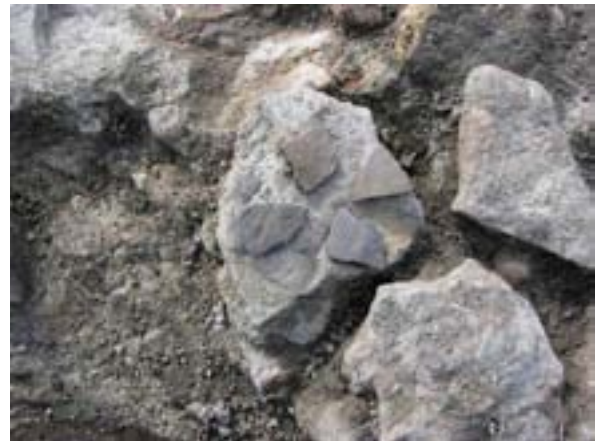
Germanische Scherben der NW-Ecke